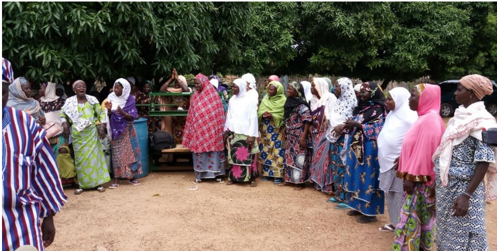
Photo 18: Photo de famille avec les bénéficiaires après la cérémonie