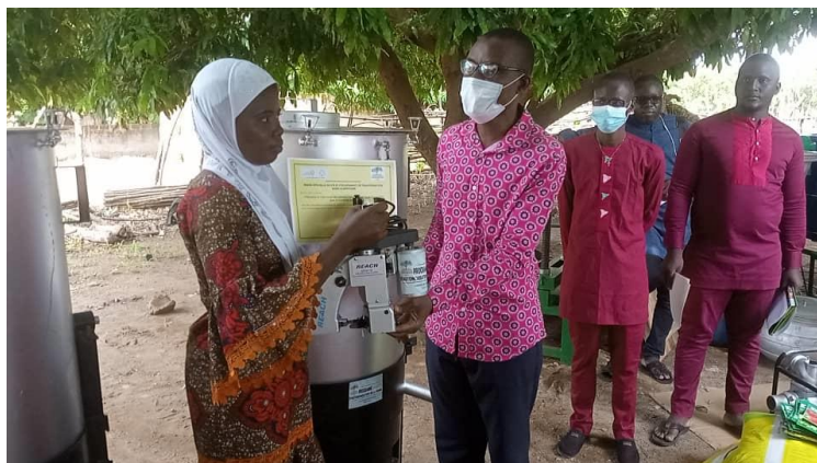
Photo 14: Remise officielle des matériels à la représentante des groupements de la plateforme « Riz » par le Chef du Centre de Promotion Sociale de Nikki (CPS Nikki)