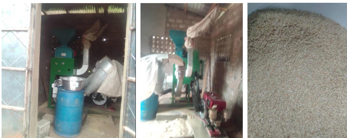
Photo 12: Installation, Essai et Formation des groupements de la plateforme "Riz" sur l'utilisation de la décortiqueuse (décortiqueuse installée et en essai : images de gauche et du milieu ; puis Riz paddy local étuvé et décortiqué lors de la formation : image de droite)

En ce qui concerne la décortiqueuse, la formation des groupements concernés s'est réalisée le Mercredi 1 er Juillet 2021 sur le site de production de la plateforme « Riz ». En effet, à l'issue de la cérémonie de remise officielle des matériels aux bénéficiaires au CPS Nikki, les différents compartiments ainsi que toutes ses petites pièces ont été convoyés vers le site de production des groupements de la plateforme « Riz » où ils ont été assemblés, montés par le mécanicien spécialisé qui a procédé également à l'installation générale de la décortiqueuse et la formation des bénéficiaires. En effet, au cours de toute cette étape, un mécanicien auto local (autochtone) fut désigné par les bénéficiaires pour assister aux réglages de la machine ainsi que les techniques de son utilisation. Ce dernier pourra, en l'absence du mécanicien spécialisé qui était venu d'ailleurs de Cotonou, assister les bénéficiaires à prendre soin de la machine en cas d'éventuelle panne.