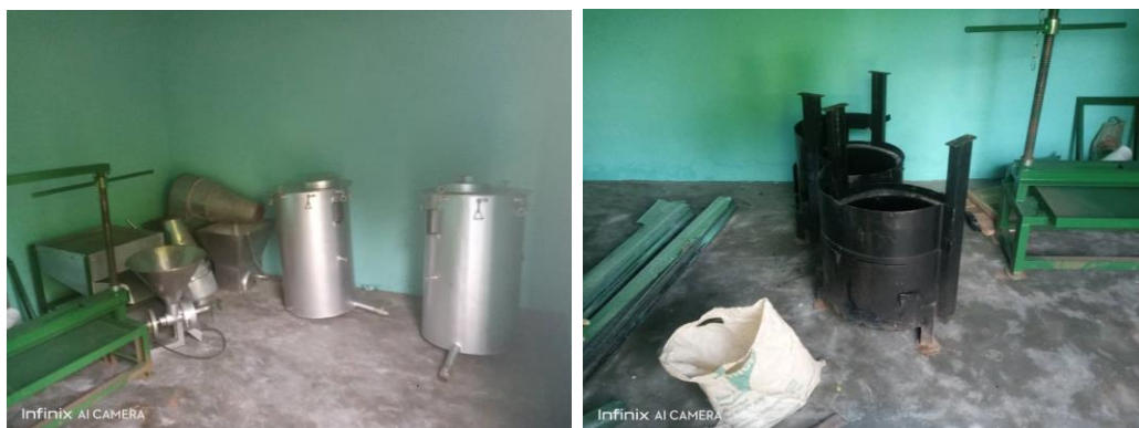
Photo 2: Entreposage des machines et équipements détachés ainsi que des matériels dans un local au CPS Nikki