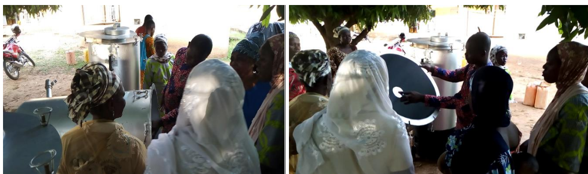
Photo 10: Formation des bénéficiaires sur l'utilisation des kits modernes d'étuvage du riz paddy