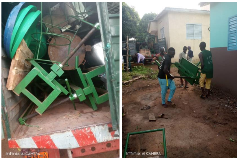
Photo 1: Arrivée du camion à Nikki (gauche) et déchargement du camion (droite)

une râpeuse de soja motorisée et mobile, trois kits modernes d'étuvage de riz paddy, une couseuse de sac de riz avec ses assessoires, une calibreuse de gari, des marmites et bassines (petites et grandes), trois grands tonneaux, des bâches de séchage, quatre presses à double vis, trois kits de traitement et de récupération du lait de soja et des matériels de production maraîchère tels que des arrosoirs, des paires de bottes, des sacs de composts (engrais biologique), des pesticides et herbicides biologiques, des semences de légumes fruits et feuilles (tomates, amarante, basilique, gombo, etc.), des houes, machettes, râteaux et une motopompe. A l'arrivée (à Nikki), tout le contenu du camion était déchargé et stocké dans un local au Centre de Promotion Sociale de Nikki où ils ont séjourné jusqu'au jour de la remise officielle.