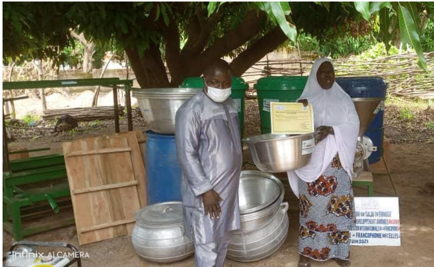
Photo 15: Remise officielle des matériels et équipements à la représentante des groupements de la plateforme « Fromage de Soja » par le 1 er Adjoint au Maire de Nikki