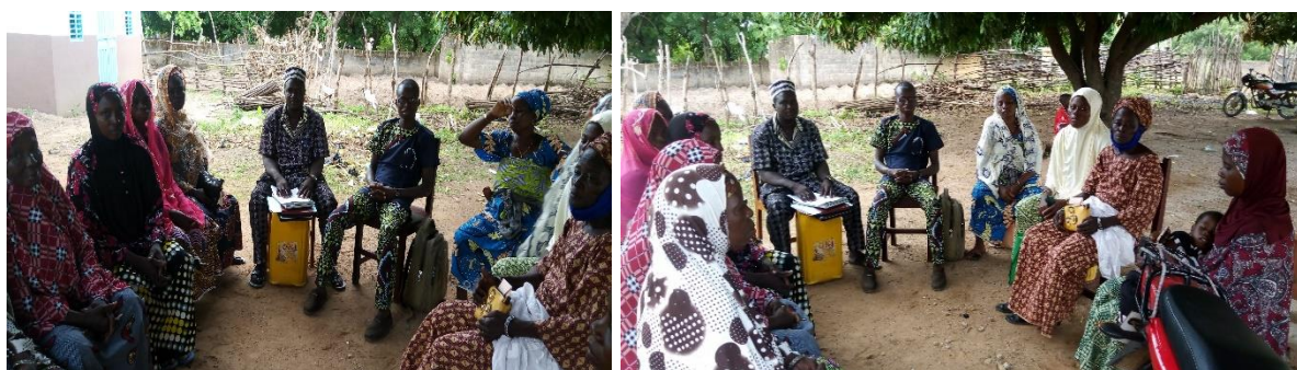
Photo 19: Séance d'échange avec les Présidentes des groupements bénéficiaires, des représentants de la communauté, du Club FAN du CEG3 Nikki et du Centre de Promotion Sociale de Nikki

En annexe 4, une copie signée de la version du contrat de partenariat retenu.