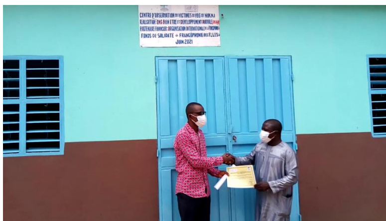
Photo 13: Remise du bâtiment du Centre d'Observation des femmes victimes de VBG au Chef CPS de Nikki par le 1er Adjoint au Maire de Nikki

Les photos ci-dessous illustrent les moments forts de la cérémonie de remise.