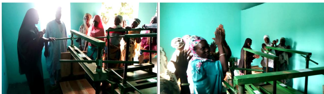
Photo 11: Formation des bénéficiaires sur l'utilisation des presses à double vis

En ce qui concerne la décortiqueuse, la formation des groupements concernés s'est réalisée le Mercredi 1 er Juillet 2021 sur le site de production de la plateforme « Riz ». En effet, à l'issue de la cérémonie de remise officielle des matériels aux bénéficiaires au CPS Nikki, les différents compartiments ainsi que toutes ses petites pièces ont été convoyés vers le site de production des groupements de la plateforme « Riz » où ils ont été assemblés, montés par le mécanicien spécialisé qui a procédé également à l'installation générale de la décortiqueuse et la formation des bénéficiaires. En effet, au cours de toute cette étape, un mécanicien auto local (autochtone) fut désigné par les bénéficiaires pour assister aux réglages de la machine ainsi que les techniques de son utilisation. Ce dernier pourra, en l'absence du mécanicien spécialisé qui était venu d'ailleurs de Cotonou, assister les bénéficiaires à prendre soin de la machine en cas d'éventuelle panne.