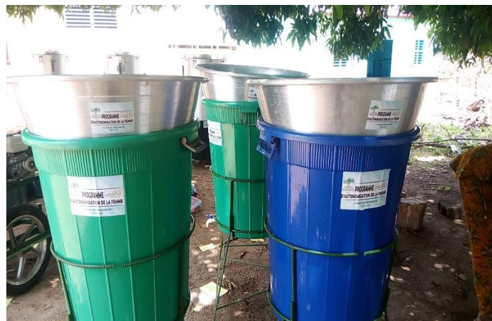
Photo 5: Assemblage et montage des dispositifs de filtrage du lait de soja