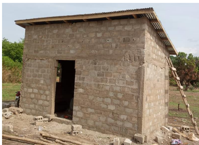
Photo 4 : Local de stockage des machines et équipements de transformation du riz paddy