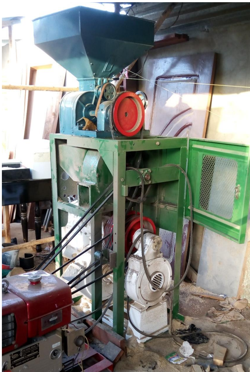
Photo 12 : La décortiqueuse de riz étuvé en cours d'essais et de réglages