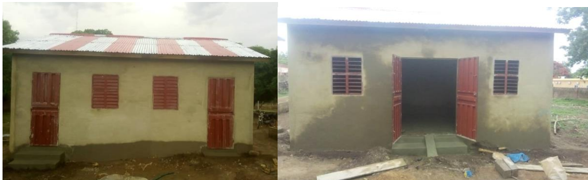
Photo 3 : Vue de l'extérieur (avant et arrière) du Centre d'Observation du CPS Nikki

Ci-dessous quelques photos illustrant les divers niveaux d'avancement et de réalisation des travaux de construction sur le terrain.