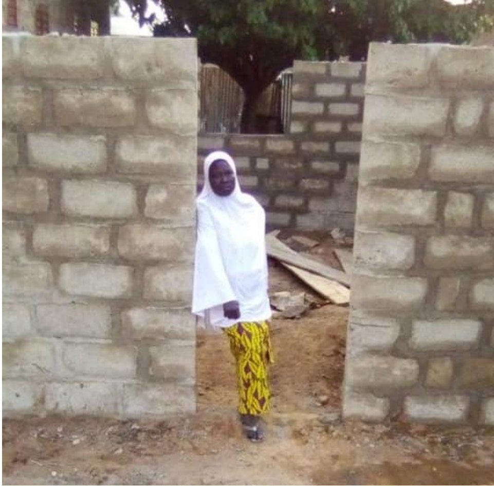
Photo 5 : Local en construction sur le site de travail des groupements de transformation du soja en fromage