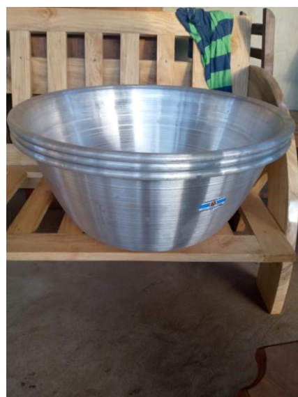
Photo 13 : Quelques petits matériels de travail pour les groupements de transformation