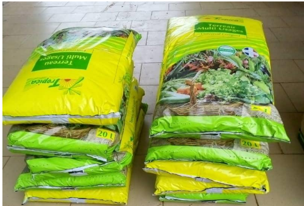
Photo 20 : Fertilisants naturels (composts/terreins) pour le maraîchage)