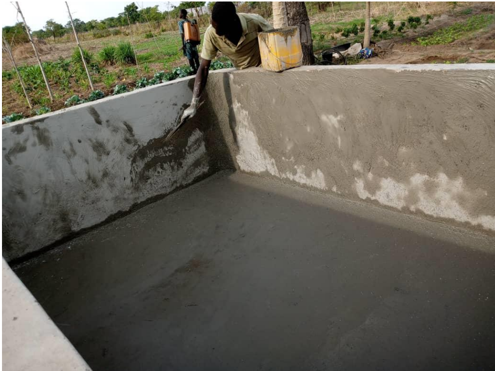
Photo 6 : Citerne pour la rétention d'eau d'arrosage sur le site maraîcher