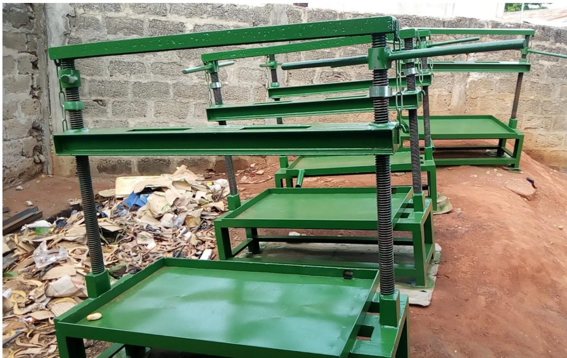
Photo 9 : Presses à double vis (doté d'un système de collecte du lait de qualité) pour le pressage du soja et manioc après le râpage