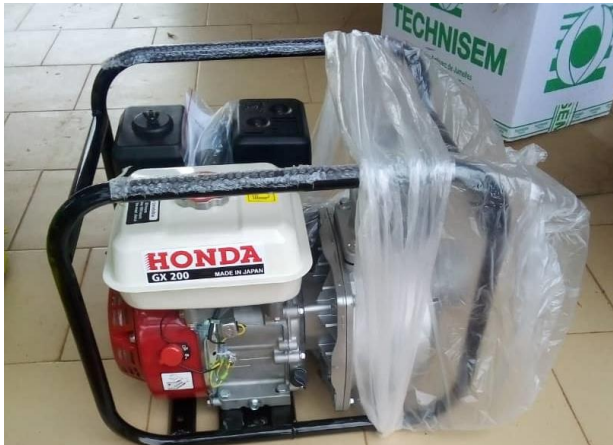
Photo 18 : Motopompe pour faciliter l'approvisionnement en eau du site maraîcher