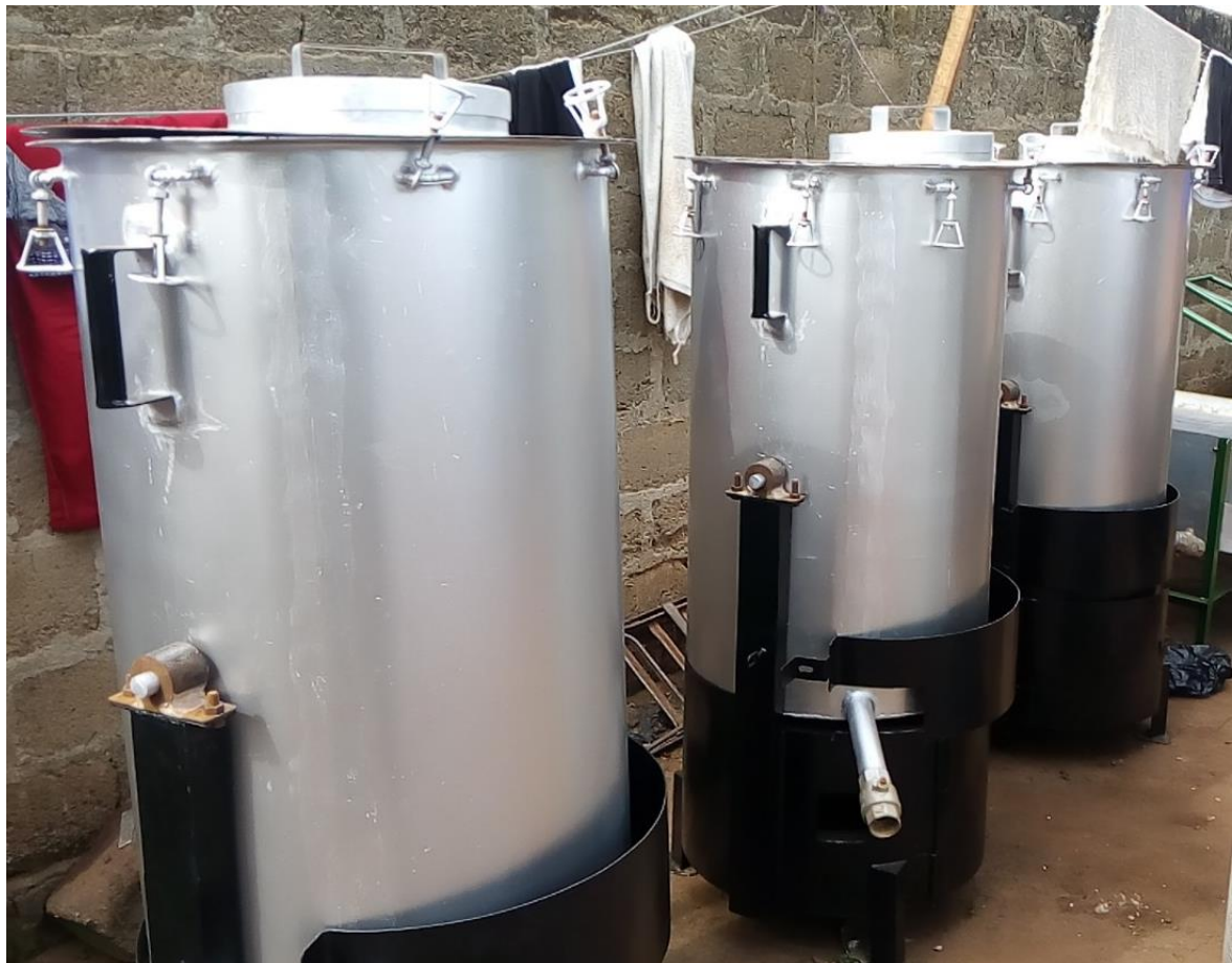
Photo 7 : Kits d'étuvage moderne et écologique (moins de fumées) du riz paddy fabriqués

Plusieurs machines de transformation du riz paddy en riz étuvé, du soja grains en fromage et du manioc en gari ont été fabriquées et acquises au profit des groupements de femmes exerçant dans les transformations agro-alimentaires en vue de leur renforcement de capacités matérielles. Ces machines ont été conçues par l'entreprise « CAFRITECH » spécialisées en mécanisation agricole. Ensuite, des matériels et équipements de travail ont été également acquis au profit des groupements de femmes exerçant dans la production maraîchère. Tous ces divers matériels sont déjà acquis et leur convoyage sur le terrain à Nikki (de Abomey-Calavi vers Nikki) est actuellement en cours d'organisation. Mais avant le convoyage de ces matériels et équipements, ils seront marqués à l'effigie du projet ainsi que du logo du département « La Francophonie Avec Elles » de l'OIF, principal sponsor du projet.