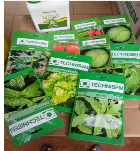
Photo 17 : Quelques intrants pour la production maraîchère (semences)