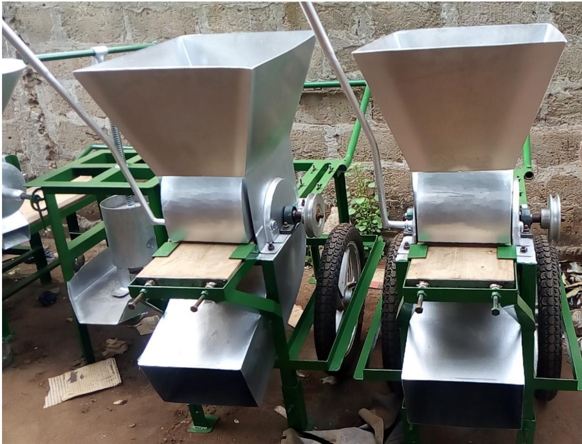
Photo 8 : Les râpeuses motorisées (mobiles) de soja et de manioc pour leur transformation en fromage et gari respectivement